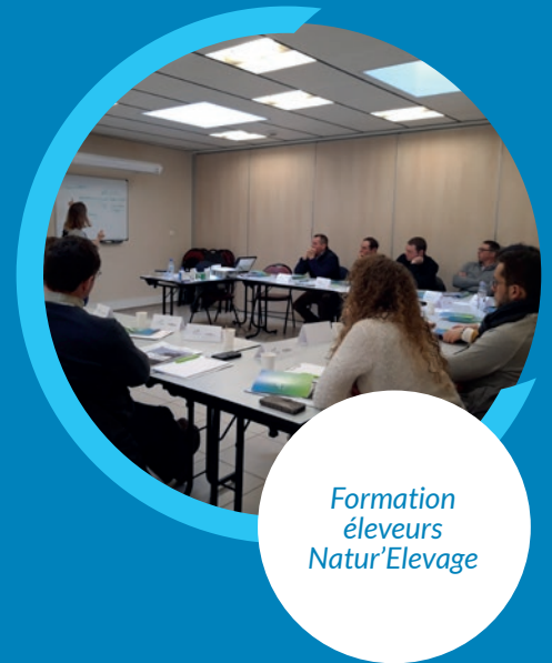
Formation éleveurs Natur'Elevage

2020. Des sessions de perfectionnement seront proposées aux éleveurs ayant suivi le premier cycle. Les personnes intéressées sont invitées à se faire connaître auprès d'Oxygen.