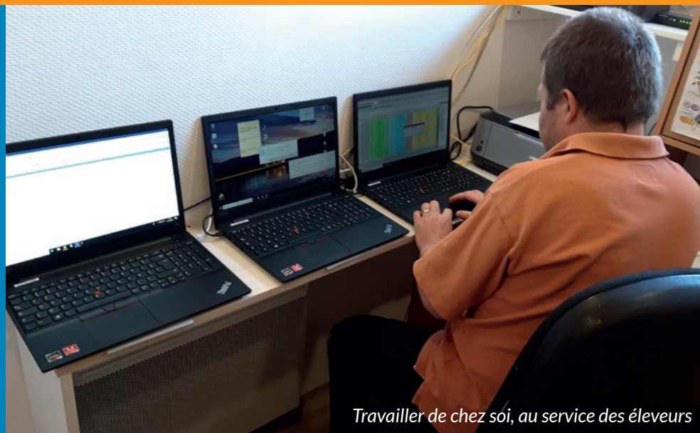
Travailler de chez soi, au service des éleveurs